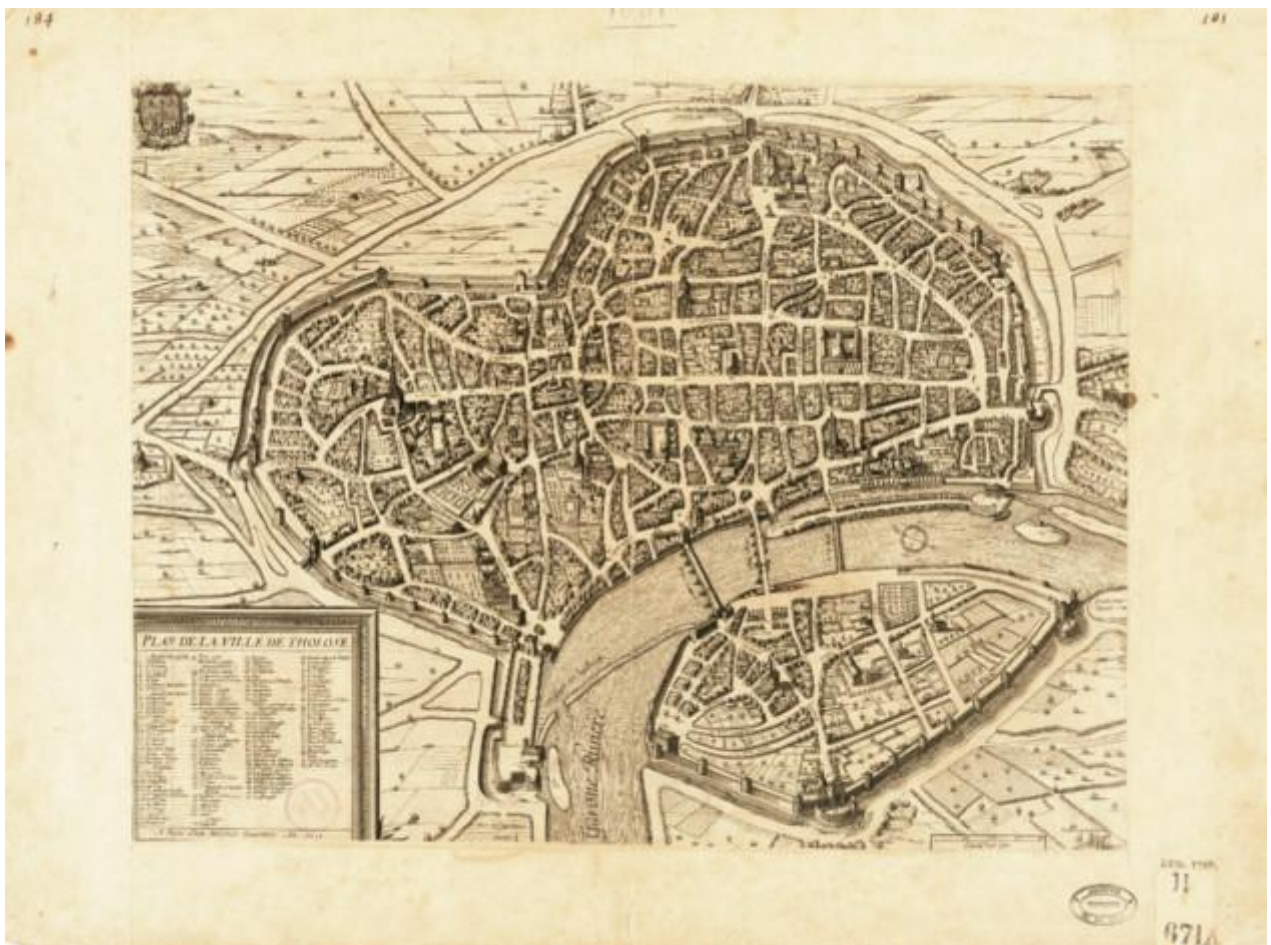
« Plan de la ville de Tholose ». 1631. Melchior Tavernier, graveur, éditeur à Paris. Ech. : env. 1/4 400. Eau-forte. Ville de Toulouse, Archives municipales, ii 671.