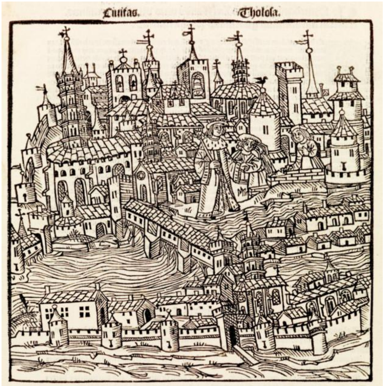
« Civitas Tholosa ». 1515. Nicolas Bertrand, Opus de Tholosanorum gestis ab urbe condita , Tholose : Industria Magistri Johannis Magni-Johannis, 1515. Gravure sur bois. Ville de Toulouse, Bibliothèque d'Étude et du Patrimoine, Res. B XVI 318

Cinq siècles, c'est l'âge du tout premier « portrait » connu de la ville de Toulouse. Cette gravure sur bois, datée de 1515, figure dans la Gesta Tholosonarum de Nicolas Bertrand. On est encore loin de la carte IGN, mais on y retrouve les principaux édifices et la physionomie générale de la cité. Ce document exceptionnel est le point de départ de Toulouse en vue(s) .