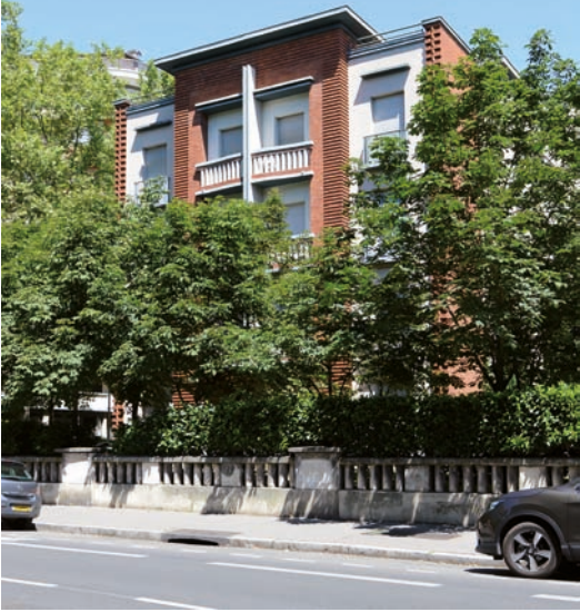
◀ Cité HBM du Grand-Rond Robert Armandary, architecte ▼ Villa Restayn, chemin des Étroits Fabien Castaing, architecte

déficit de la reconnaissance de ce qui fait l'histoire architecturale et urbaine de Toulouse. Nous n'avons pas de lieu ou de musée de l'histoire de la ville qui montrerait ces plans et avec eux l'histoire urbaine de la ville.